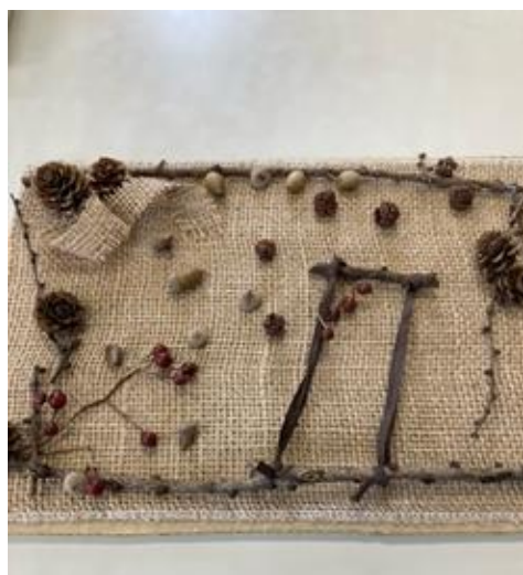
麻布にどんぐりや松ぼっくり、小枝などを 貼り付けたタペストリー♡