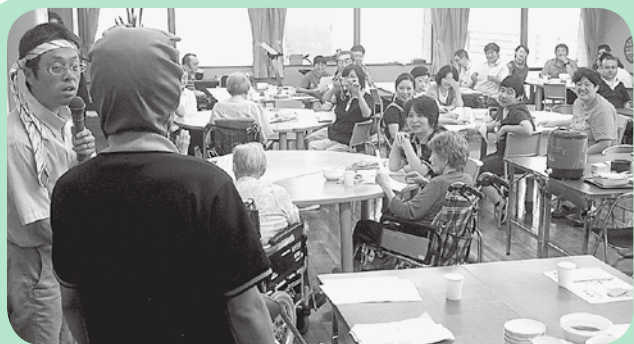
酔いどれギターに合わせて大合唱