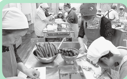
こまかく切るの難しい・・・!

天ぷら(かき揚げ)、特製冷ややっこ、プリン・アラモードの4品! 「あー、おなか一杯!」の声が会場のいたるところから響きました! 美味しい食事と、楽しいレクリエーション。会が終わった後の皆さんのステキな表情を、織姫と彦星も星空から見つめていたのではないのでしょうか。