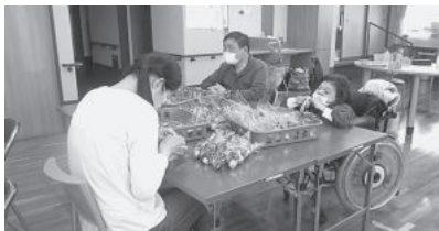
軽井沢ウィンターフェスティバル用 プレゼント袋詰め作業

地域活動支援センターでは、お仕事に取り組むときも余暇を過ごすときも真剣に向き合ってきました。 直近で取り組んだお仕事・レクの一部についてご紹介します。