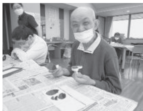
「おくすりてちょう」制作