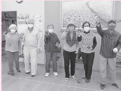
千ヶ滝西区チーム

「千ヶ滝西区」チームが、1月28日に開催された県大会に出場しました。「老人クラブふれあいの会」・「地区社会福祉協議会」・「通いの場」のメンバーで構成された同チームは、心と体の健康のため2回、公民館で練習に励んでいます。共通の目標に向かうことで、絆が強くなったと話されるチーム千ヶ滝西区の皆さんから「多くの方と楽しみを共有したい。ぜひ一緒に活動しましょう！」と話されていました。ポッチャは性別や年齢、障がいの有無を問わないスポーツとして多くの方が楽しめるスポーツです。皆さんも是非、ポッチャに挑戦してみてください。