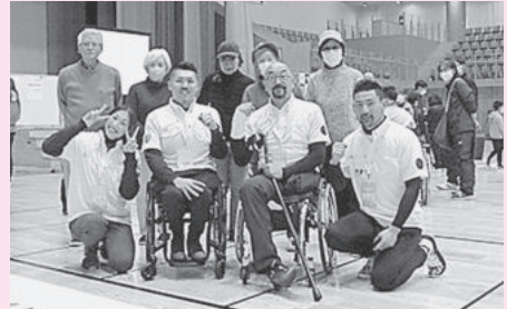
長野県出身のオリンピック・パラリンピック信州メダリストチームの皆さんと一緒に。