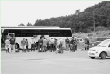
ボランティアバスパック