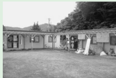
建物左：社協事務局 建物右：ボランティアセンター