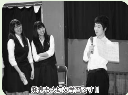
発表も大切な学習です!!