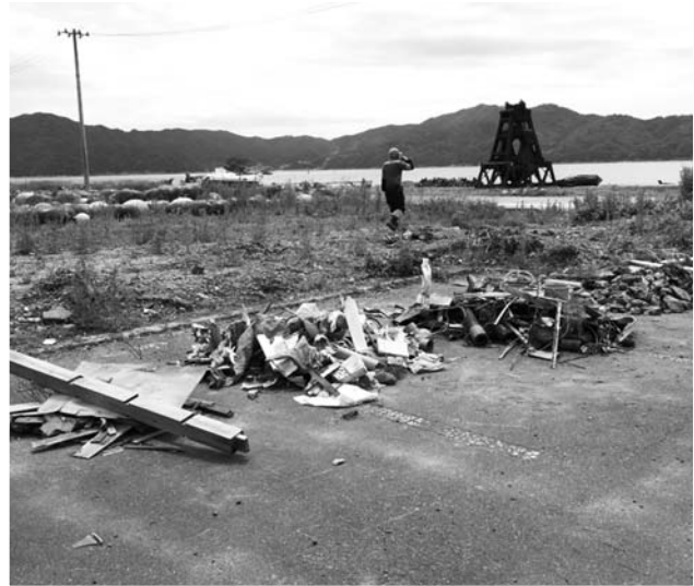
ゴミ拾いの成果です。ゴミにもいろいろなものがあり分別に戸惑いましたが、整理しまとめてきました。