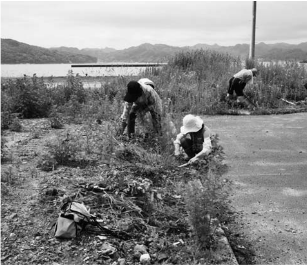
水産加工工場周辺で草むしり・ゴミ拾いしているボランティアさん。なかなか根がはっているものもあり抜きがいがある作業でした。

活動内容は、水産加工工場周辺のゴミ拾い・大槌町国道45号線沿いにある花壇に観葉植物のコリウス等を植える作業でした。