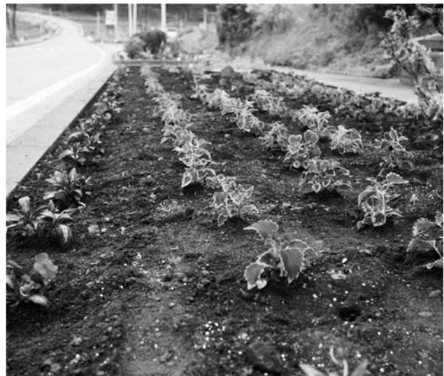
花植えが終わり、地元の方と花植えの成果と、国道沿いがきれいになることを話し、成長が楽しみだと「希望」も植えてきました。

今回雨の中でのボランティア活動でしたが、ボランティアの皆さま、地元の皆さまの協力もあり無事活動を行うことができました。