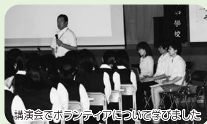
講演会でボランティアについて学びました