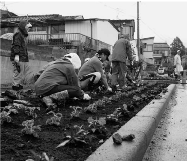
雨に降られてしまいましたが、地元の方・大槌町ボランティアセンターの方々と協力しあい一生懸命花植えをしました。