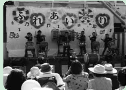
第8回 ふれあい祭り

残りの約3割 (1,482,000円) が長野県共同募金会の事業へ活用されます。