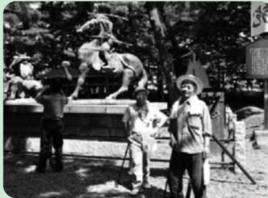
心身障害者・児希望の旅