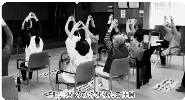
軽井沢 のびのびりんご体操

10月～11月にかけて後期の「足腰お達人教室」が始まります! 後期では、栄養士によるバランスがとれた食事のお話や、毎年恒例の体力測定をしますので、大勢の方のご参加をお待ちしております。詳細は、各地区の回覧版をご覧ください。