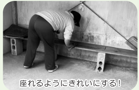
座れるようにきれいにする!