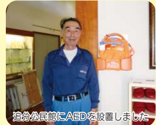
追分公民館にAEDを設置しました