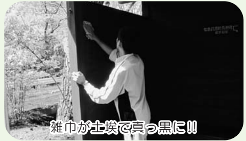
雑巾が土埃で真っ黒に!!