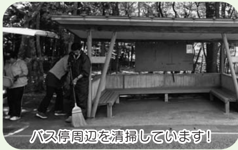
バス停周辺を清掃しています!

地域の皆さんや軽井沢町を訪れる観光客の方に「気持ち良く利用していただきたい」と心がけて清掃を続けています。