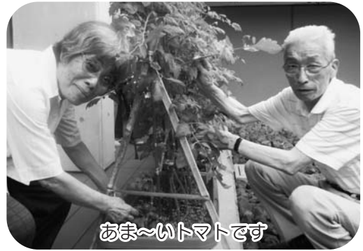
あま〜いトマトです

6月の初めに「花とみどりの仲間たち」の皆さんの手伝いもあり、デイルーム前に花や野菜の苗植えをしました。植えてから長雨が続き日照時間が少なく、とってもスローペースな生育でしたが、野菜を収穫するときの利用者さんの笑顔はとても素敵でした。