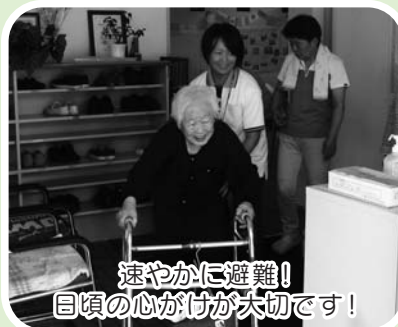
速やかに避難! 目頃の心がけが大切です!