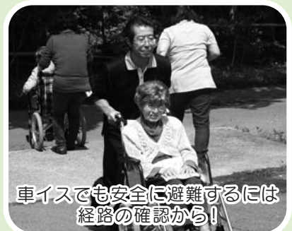
車イスでも安全に避難するには 経路の確認から!