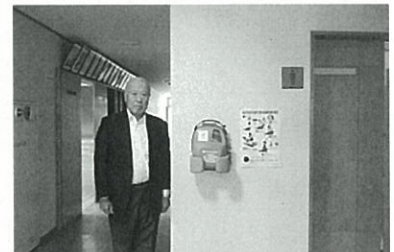
借宿公民館にAEDを設置しました。

*平成29年度は、借宿区と大日向区に救急機材[AED]の配分を受けました。 *今年度の申請は11月の予定です。 希望する区は申請をお忘れなく！