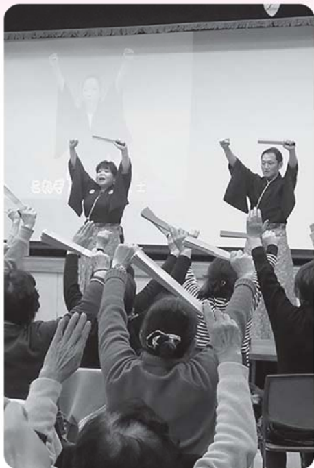
手作りの扇子を手に持ち 歌に合わせて体操

11月から12月にかけて中央公民館で音楽と体操を取り入れた「音楽レクリエーションサポーター養成講座」が開催されました。