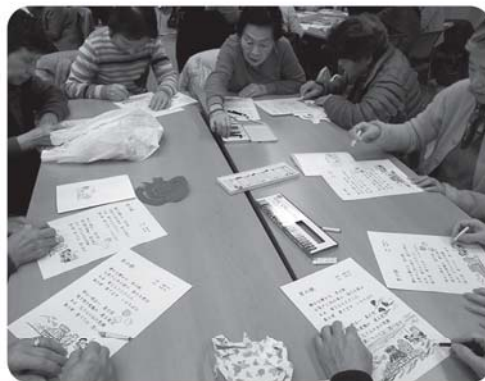
「里の秋」の歌をうたいながら 塗り絵