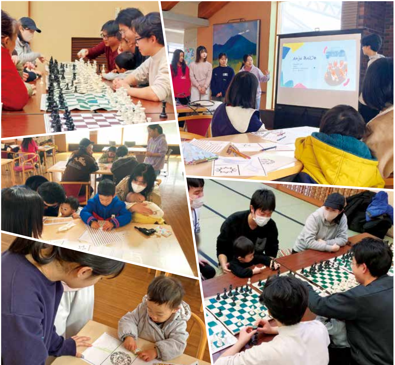
町内にあるインターナショナルスクール (ISAK) の生徒さんによる地域交流イベントの様子です。