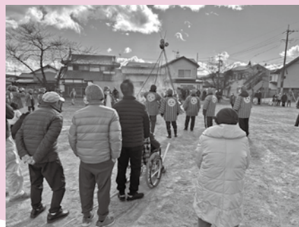
〈1月はまゆ玉づくり、狩野公園で行われたどんど焼きに参加しました〉