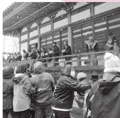
〈2月は寶性寺で行われた豆まきに参加しました〉

まさちゃん家とは…正式名称は小規模多機能型居宅介護事業所と言います。軽井沢町に住所があり、介護保険制度の要支援、要介護の認定を受けた方が、住み慣れた自宅での生活を続けるために、通い・訪問・泊まりの3つのサービスを組み合わせて支援させていただき事業所です。地域の皆さまには、大変お世話になっており、地域行事にお声がけいただいたりと積極的に交流させていただいております。昨年10月に事業所を木もれ陽の里内に移し、新たな場所でサービスを提供しております。利用する方の生活を支援することはもちろん、自宅で介護されているご家族の負担軽減も目的としています。ご利用に際しましては、お気軽にお問い合わせください。